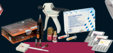
GRADIA® CORE & Fiber Posts