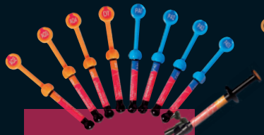
GRADIA® DIRECT Family